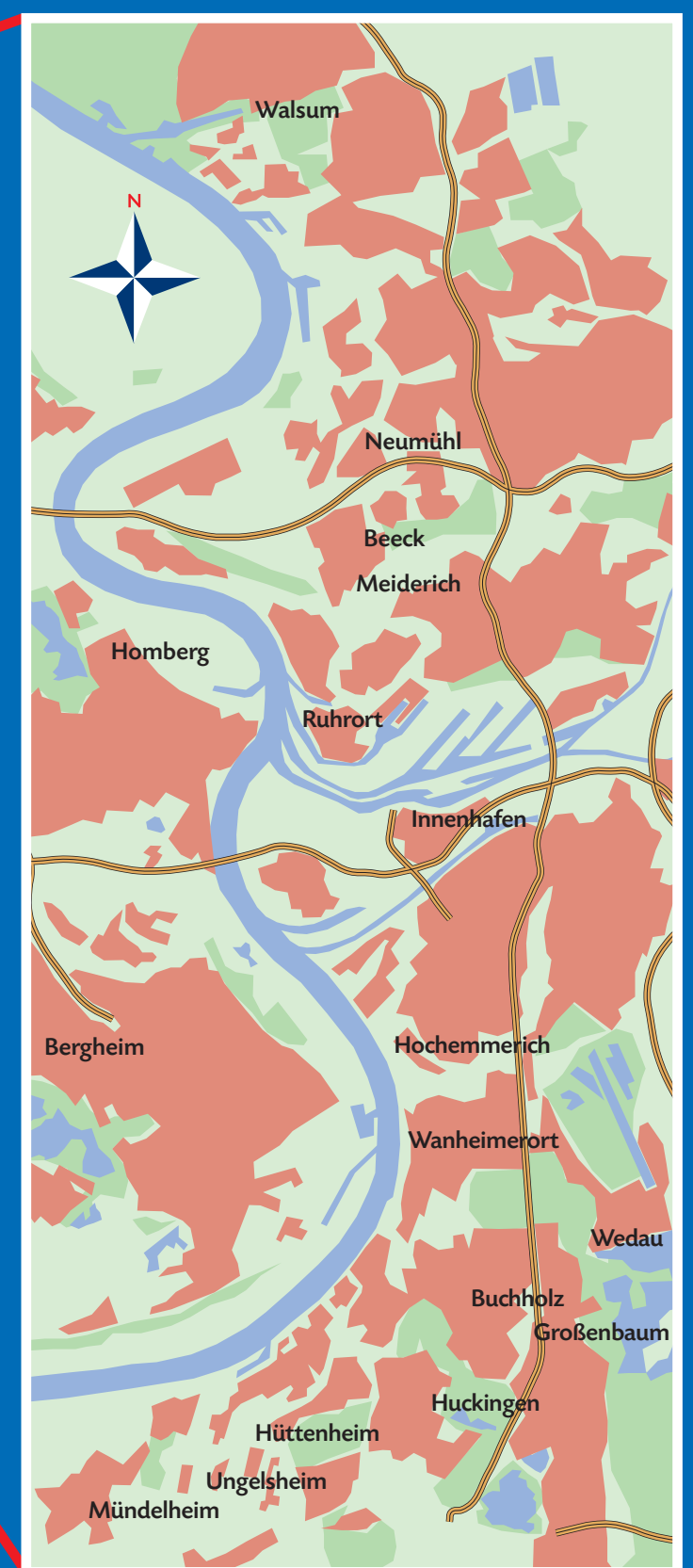
Fokus: LEG-Wohnungsbestand in Duisburg